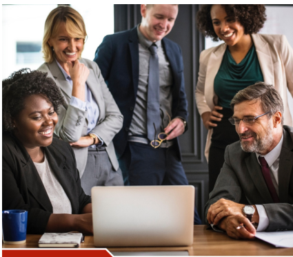
Programm Qualifizierungsworkshops 2. Halbjahr 2019